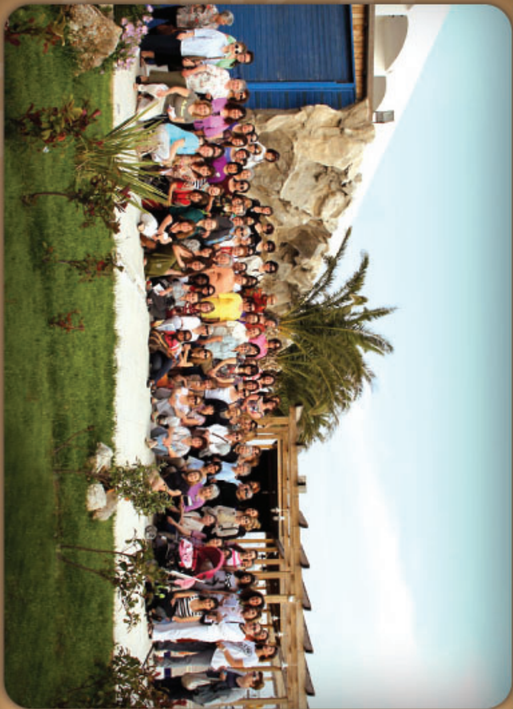
1ο Συνέδριο Χριστιανών Γυναικών Νοτίου Ελλάδος 2011 - Κινέττα